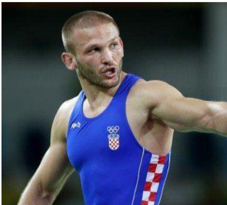
Slika 76. Božo Starčević (Fotografija s interneta)

( http://shs-zgb.hr/najuspjesniji-zagrebacki-hrvaci/bozo-starcevic/ ) Autor: nepoznat