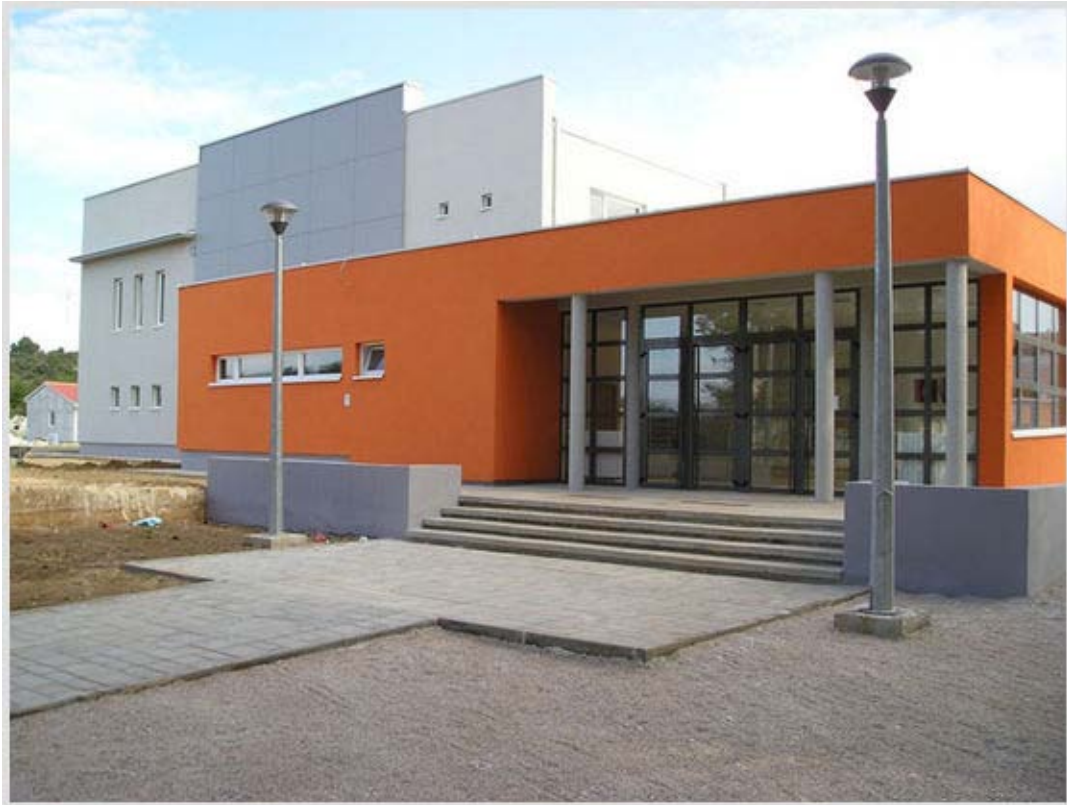
POGLED NA SPORTSKU DVORANU IZ VANA

Što se tiče uvjeta za trening u blizini hotela (cca. 300 metara) nalazi se novoizgrađena dvorana sa svim sadržajima potrebnim za normalo održavanje treninga. U samom mjestu postoji i trim staza za jutarnje trčanje i razgibavanje.