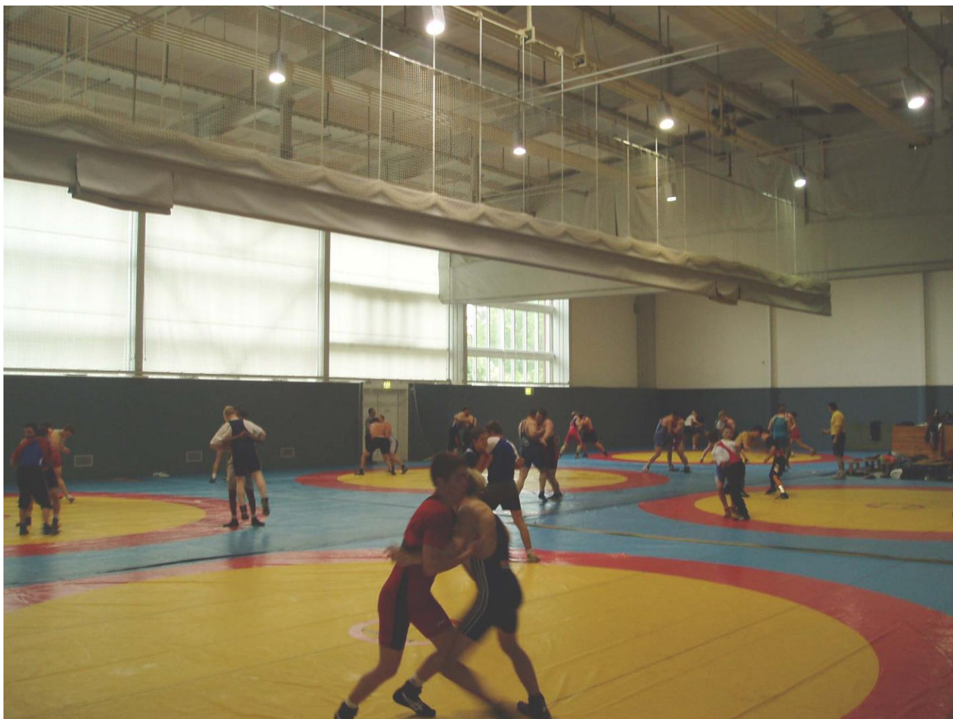
Slika 4. Njemačka. Frankfurt na Odri pripreme hrvatske kadetske reprezentacije u jednom od njihovih hrvačkih centara 2006. godine.

Suradnja sa Hrvatskom vojskom može dijelom riješiti te problem, no najveći problem npr. u Lošnju je mogućnost postavljanja samo jedne strunjače (16 x 9 metara). Savez treba u suradnji sa HOO, gradovima i županijama, napraviti sve potrebno da se u Republici Hrvatskoj osigura 1-2 lokacije, sa svom potrebnom opremom i rekvizitima za zadovoljavanje uvjeta Hrvatskog hrvačkog centra za pripreme reprezentacije (3-4 fiksno postavljene strunjače, užad za penjanje...), a u kojima će se pripremati hrvatske i strane reprezentacije i klubovi. Samo tada, hrvatski hrvači imati će dovoljno dobre uvjete da jedan broj priprema odrade u Republici Hrvatskoj sa dovoljnim brojem sparinga.