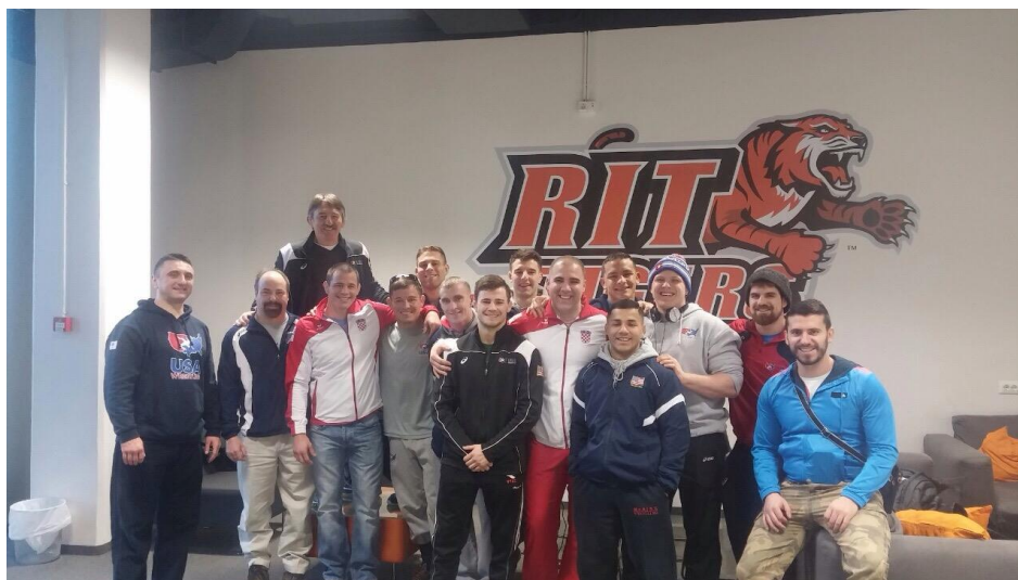
Slika 5. Podružnica Američkog fakulteta u Zagrebu Posjet dijela američke hrvačke reprezentacije tom fakultetu

Razvojem slobodnog stila starvaju se pretpostavke za odlaske hrvatskih hrvača i hrvačica na školovanje i treninge u USA (poput plivača, atletičara..), a pokretanjem suradnje sa USA fakultetima u Republici Hrvatskoj za dolazak američkih hrvača grčko-rimskog načina na školovanje i treninge u Zagreb i Republiku Hrvatsku. Naime, hrvačima iz USA to je vrlo zanimljiva ponuda jer se ti fakulteti u Republici Hrvatskoj znatno manje godišnje plaćaju, a hrvačima iz USA se daje mogućnost kvalitetnog treninga i natjecanja u regiji. Time se, također, značajno podiže javni – akademski status hrvanja u Republici Hrvatskoj, a u Republici Hrvatskoj se povećava značajno broj hrvača koji vrlo dobro poznaju i slobodni način borenja te mogu pomoći u razvoju ovoga načina borenja.