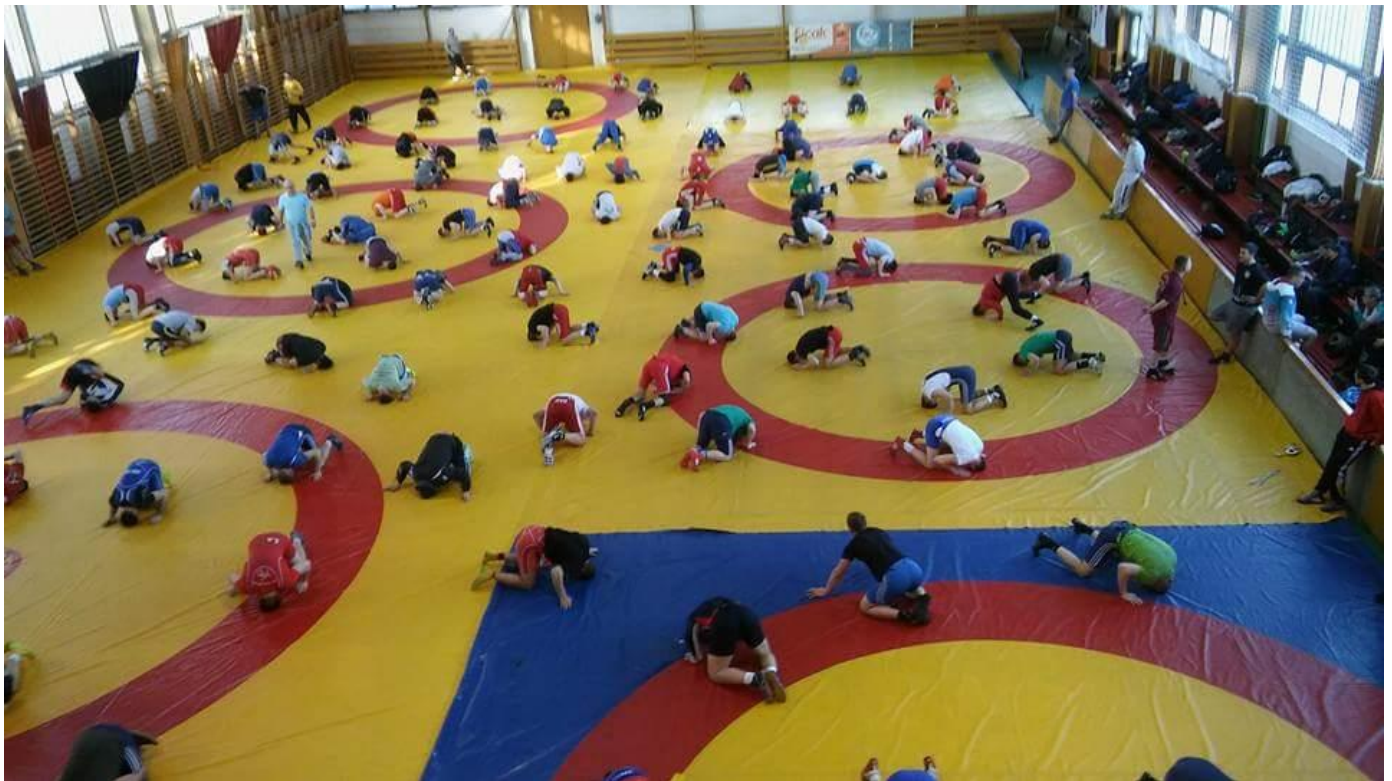
Slika 2. Specifične pripreme mađarske juniorske i kadetske reprezentacije u Dorogu (Mađarska) od 20. do 25.3.2016. godine koje su se odražale nakon jakog međunarodnog juniorskog turnira “Blak Diamond Cup” u Dorogu 18. i 19.3.2016. godine. Na navedenom turniru sudjelovalo je ukupno 17 država s preko 200 hrvača, a na pripremama nakon turnira ostalo je 70 – tak hrvača iz 11 država (HUN, CRO, USA, RUM, LTU...).

Kao primjer dobre prakse ponovno podsjećamo na primjer gdje hrvači ukrajinskih klubova dolaze kod nas na međunarodno natjecanje i pripreme u Zadar (dječaci i kadeti), a po istom principu zovu i nas da dođemo kod njih (udaljeni su od Zagreba manjeod 800 km). Slična situacija je i sa rusima iz regije Jaškarola (RUS) koji nude našima hrvačima kadetima besplatne pripreme i turnir samo po cijeni avio karte (cca 350 Eura), odnosno žele i oni po istim uvjetima doći na pripreme i natjecanje kod nas u Hrvatsku. Vrlo dobru suradnju imali smo ranije sa Bjelorusima po pitanju priprema i natjecanja junior i senior, a što se relativno brzo može obnoviti itd.