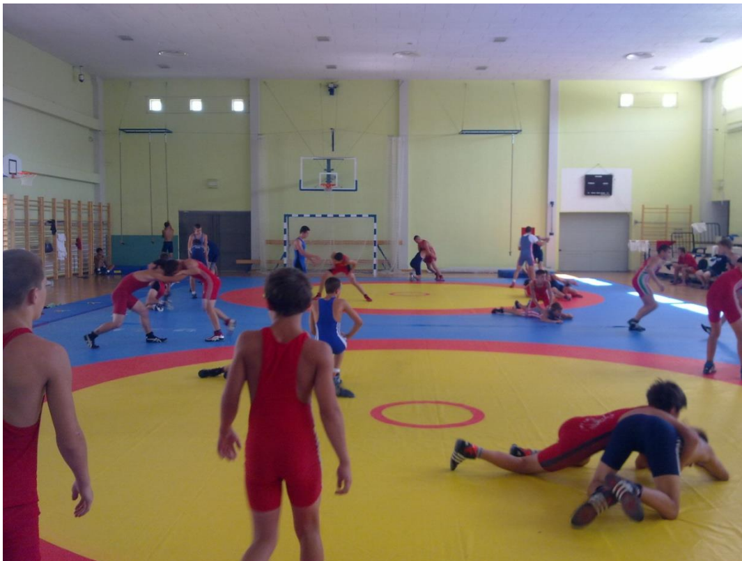
Slika 3. Ljetna škola hrvanja u Pakoštanima 2010. godine (dječaci) s mađarskom reprezentacijom

Npr. kod kadeta i juniora prisutan je problem što se sa bazičnim priprema kadeta kreće prekasno, u prvom mjesecu, a optimalno bi bilo odmah poslje ljeta nakon što završe EP i SP za kadete. Navedeno je potrebno riješiti boljim planiranjem priprema i natjecanja, odnosno uvažavanjem navedenoga prilikom izrade kalendara natjecanja i priprema. U ovim uzrastima, također je prisutan problem premalog dodatnog individualnog rada sa najboljim pojedincima kojeg bi trebalo organizirati putem pokretanja dodatnih treninga gradskih ili županijskih/regionalnih selekcija, angažiranjem trenera savjetnika koji dolazi iz tzv. ruske škole hrvanja u radu s nacionalnim selekcijama/gradskim ili županijskim/regionalnim selekcijama te najboljim trenerima i hrvačima.