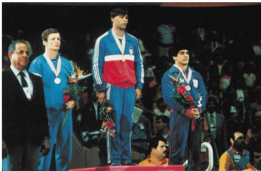
Slika 1. Vlado Lisjak na postolju (Olimpijske igre, Los Angeles 1984.)

Cilj ovoga rada je izrada strategije razvoja hrvatskog hrvanja u period od 2016. do 2020. godine. Alat kojim su se autori služili u izradi strategije bila je SWOT analiza (tablica 3.). Međutim, treba uzeti u obzir da se radi o subjektivnoj metodi, iako su u njoj izradi korišteni i podaci dobiveni analizom dostupne literature 2 te ostali dostupni dokumenti i analize rada najuspješnih hrvačkih saveza u Svijetu.